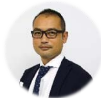
株式会社アクティブ アンド カンパニー 人材開発事業部 シニアコンサルタント